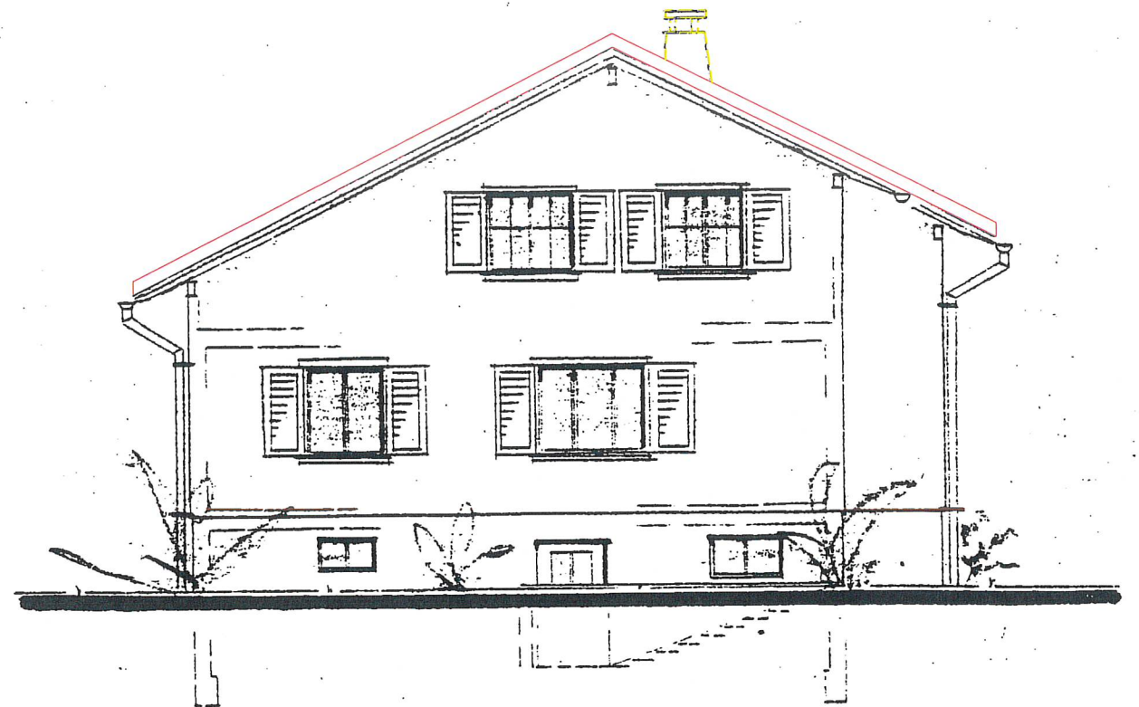
NORD - OST - ANSICHT