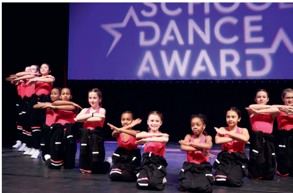
2. Platz für die erfolgreiche Formation «Dancesation»

Da soll noch ein behaupten die Entfelderinnen könnten nicht tanzen. Nachdem bereits frühere Formationen Erfolge feiern konnten gelang dies auch bei der 178. Auflage des Aargauer School Dance Awards. Die «Dancesation» sicherte sich durch Toptänze den 2. Rang