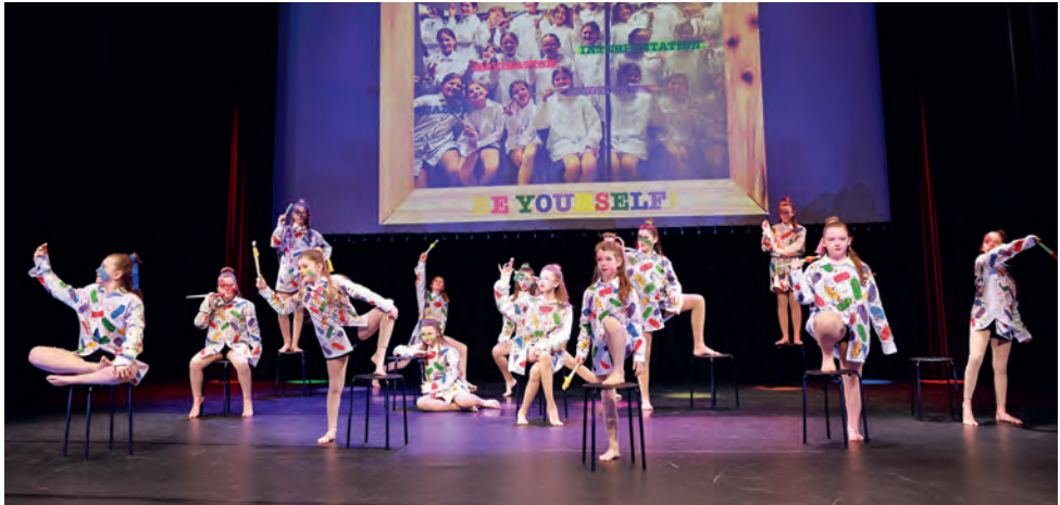
Die Gruppe «Unique» der Schule Entfelden