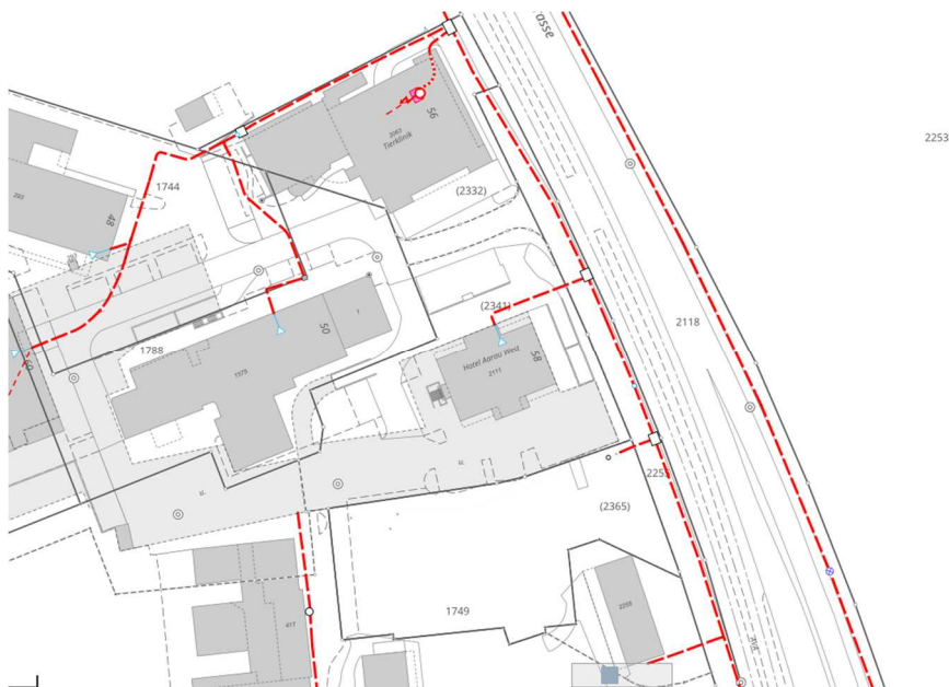
Stand 1. April 2024